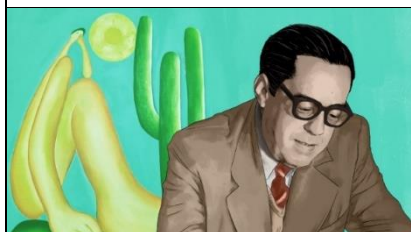
Sergio Buarque de Hollanda

É importante para pensar como nosso passado colonial impacta na sociedade até hoje.