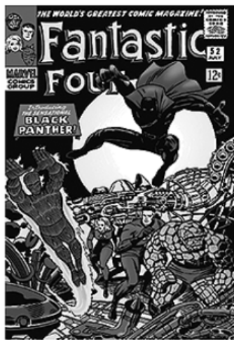
Em 1966, surge nos quadrinhos, junto ao "Quarteto Fantástico".