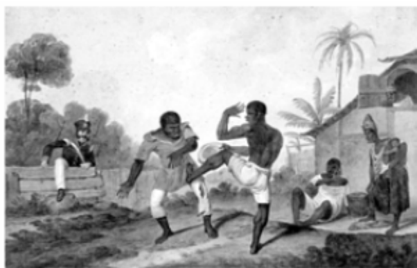
Augustus Earle. Negros Lutando . C 1824, aquarela sb/papel 16,5 x 25 cm.

(Imagens extraídas de: ALMEIDA, H. B.; SZWAKO, J. E. Diferenças, Igualdade . São Paulo: Berlendis & Vertecchia, 2009, pp. 73, 76, 78, 86, 95.)