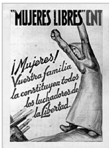
ANÓNIMO. Cartaz da Guerra Civil Espanhola. "Mulheres livres", CNT (Confederação Nacional do Trabalho). Frases do cartaz: "Mulheres! Constituem vossa família todos os lutadores da liberdade". Disponível em: < www.lume.ufrgs.br/bitstream/handle/10183/36937/000819354.pdf >. Acesso em: 24 set. 2014.

Elaborado durante a Guerra Civil Espanhola (1936-1939), o cartaz apresentado transmite uma imagem de família estruturada sobre um princípio que