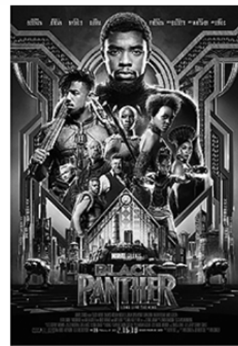
Em 2018, é o herói em filme de ficção científica.