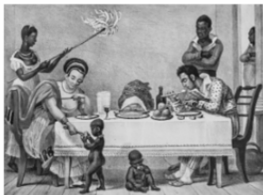
Jean Baptiste Debret. O Jantar , 1835, litografia.