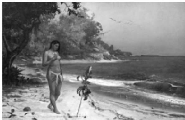
José Maria de Medeiros. Iracema , 1884, óleo de sb/tela 168 x 255 cm.