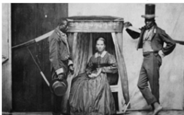
Senhora na liteira com dois escravos.