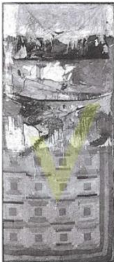
RAUSCHENBERG, R. Cama. Óleo e lápis em travesseiro, colcha e folha em suporte de madeira. 191,1 x 80 x 20,3 cm. Museu de Arte Moderna de Nova York, 1995. Disponível em: www.moma.org . Acesso em: 8 jun. 2017.