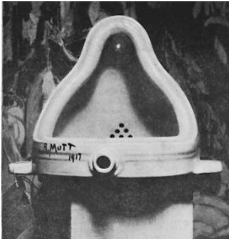
DUCHAMP, M. A Fonte.

7. A peça A fonte foi criada pelo francês Marcel Duchamp e apresentada em Nova Iorque em 1917.