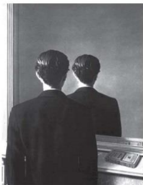
MAGRITTE, R. A. A reprodução proibida.