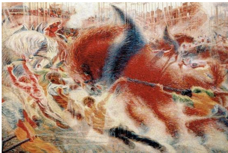
Umberto Boccioni. The City Rises 1910, óleo sobre tela.

Com relação à imagem apresentada e a aspectos relativos à arte que ela representa, assinale a opção correta.