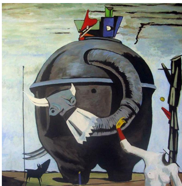
ERNEST, M. O gigante acéfalo.