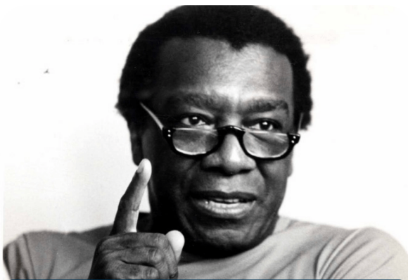
Milton Santos, um dos maiores Geógrafos do mundo

O geógrafo brasileiro Milton Santos é uma fonterecorrente para abordar a globalização, por causa de uma das suas obras mais famosas “Por Uma Nova Globalização”. Nessa obra Milton Santos aborda a globalização de três pontos de vista: