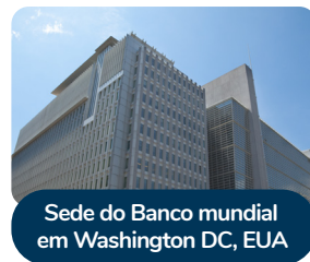
Sede do Banco mundial em Washington DC, EUA

► Banco Mundial: O Banco Mundial tinha a tarefa principal de financiar a reconstrução econômica dos países devastados pela Guerra, principalmente na Europa. Posteriormente, o Banco Mundial reorientou seu foco para apoiar programas de desenvolvimento nos países subdesenvolvidos.