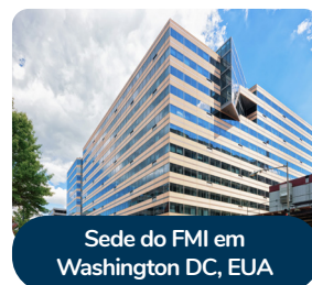
Sede do FMI em Washington DC, EUA