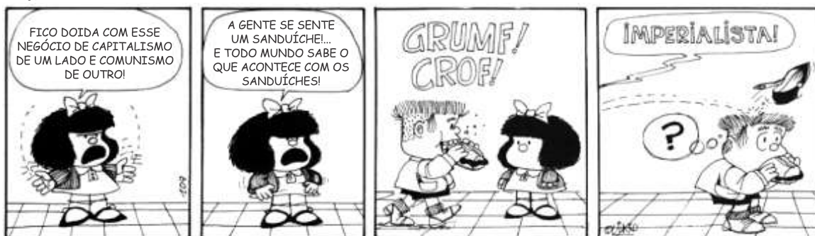
QUINO Toda Mafalda, 2003.

Publicados originalmente na Argentina, entre os anos de 1964 e 1973, os quadrinhos da Mafalda expressavam o olhar de seu autor sobre os acontecimentos da época.