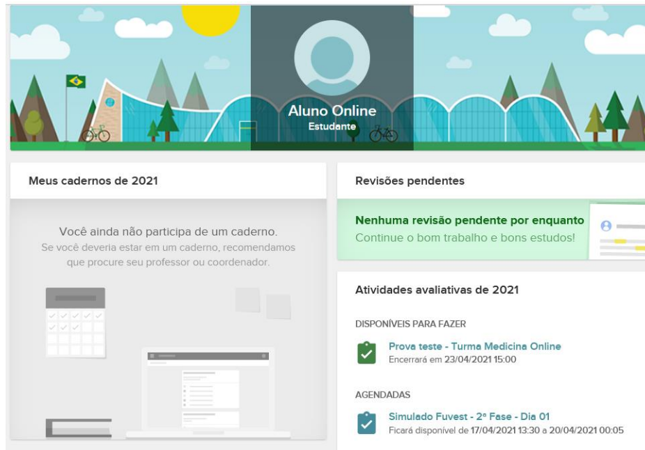
Figura 4: Atividades avaliativas

Clique sobre a prova que deseja realizar. Você será direcionado para tela de início da prova selecionada. Leia as instruções atentamente e clique em “Iniciar” como mostrado na figura 5.