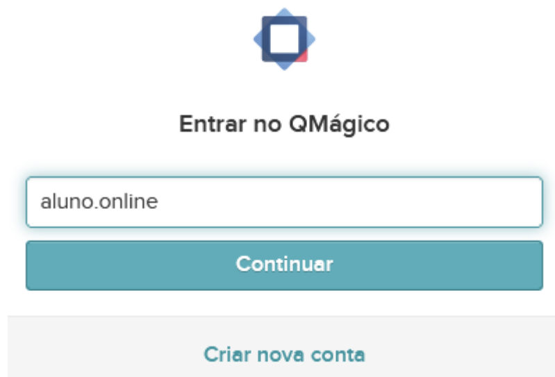
Figura 2: Login