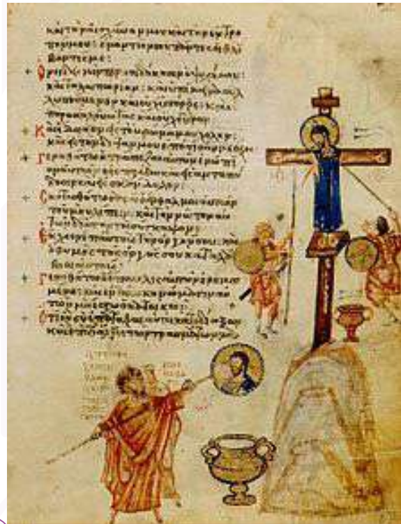
O Iconoclasmo - Saltério de Chludov.