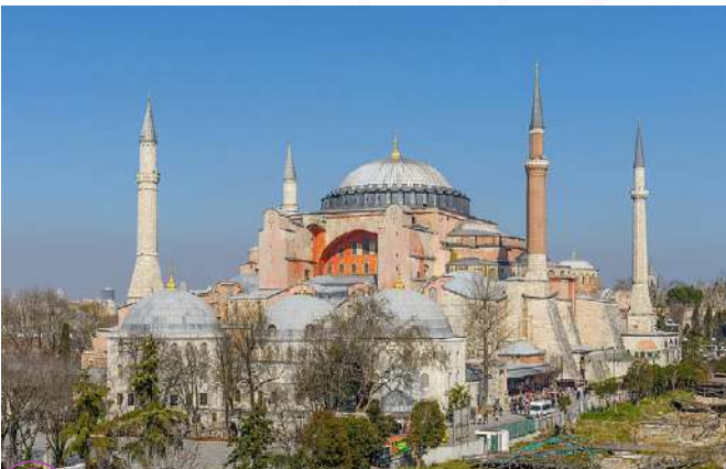
A Catedral de Santa Sofia - fotografia de Arild Vågen.