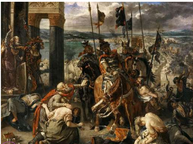
A entrada dos Cruzados em Constantinopla Eugène Delacroix (1840).