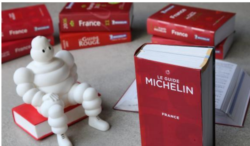
Le guide Michelin (guide Rouge) 2018.

Le Guide Michelin dévoile lundi son palmarès 2018 des restaurateurs étoilés. Il y aura ceux qui en gagnent, et ceux qui devront en effacer de leur devanture. Une perte qui n'est pas sans conséquences.