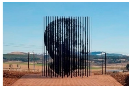
Marco Cianfanelli, Release (Soltura), 2012, África do Sul, aço pintado e cortado a laser, profundidade 20,8 m, altura 9,48 m e largura 5,19 m.

As imagens apresentam, de diversos ângulos, a escultura de Marco Cianfanelli em homenagem ao 50º aniversário da captura e prisão de Nelson Mandela, em 1962. A obra é composta por hastes de aço de altura variável, cortadas a laser e inseridas na paisagem, na província de KwaZulu-Natal, onde Mandela foi detido pelo regime do apartheid . Ao comentar a sua obra, o artista afirmou: "As 50 colunas representam os 50 anos que se passaram desde a sua captura, mas também sugerem a ideia de que muitos compõem um conjunto; referem-se à solidariedade. Indicam a ironia de que o encarceramento de Mandela o transformou em um ícone de luta, alimentando a resistência que levou o país à democracia".