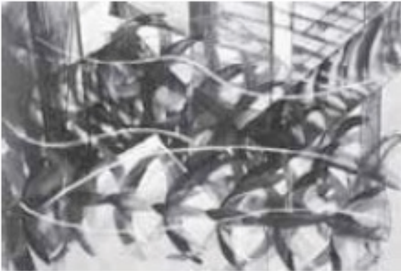
BALLA, G. Voo de andorinhas . Têmpera sobre papel, 50,8 cm x 76,2 cm x 20 cm. The Museum of Modern Art, Nova Iorque, 1913.

Disponível em: www.mozaweb.com . Acesso em: 4 jul. 2021.