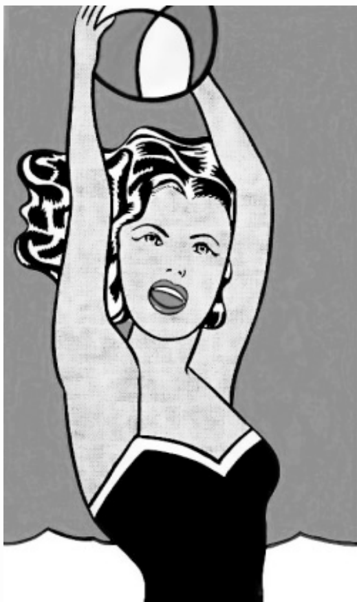
LICHTENSTEIN, R. Garota com bola . Óleo sobre tela, 153 cm x 91,9 cm. Museu de Arte Moderna de Nova York, 1961. Disponível em: www.moma.org . Acesso em: 4 dez. 2018.

A obra, da década de 1960, pertencente ao movimento artístico Pop Art , explora a beleza e a sensualidade do corpo feminino em uma situação de divertimento. Historicamente, a sociedade inventou e continua reinventando o corpo como objeto de intervenções sociais, buscando atender aos valores e costumes de cada época.