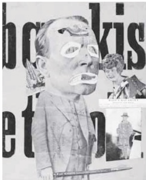
HAUSMANN, R. O crítico de arte . Litografia e fotocolagem em papel, 32 cm x 25,5 cm. Tate Collection, Londres, 1919.

Disponível em: https://medium.com . Acesso em: 19 jun. 2019.