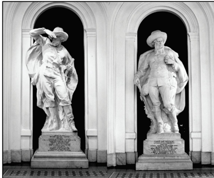
Fonte: Imagens das estátuas de Antônio Raposo Tavares [esq.] e Fernão Dias Pais [dir.], existentes no salão de entrada do Museu Paulista, São Paulo.

Essas duas estátuas representam bandeirantes paulistas do século XVII e trazem conteúdos de uma mitologia criada em torno desses personagens históricos.