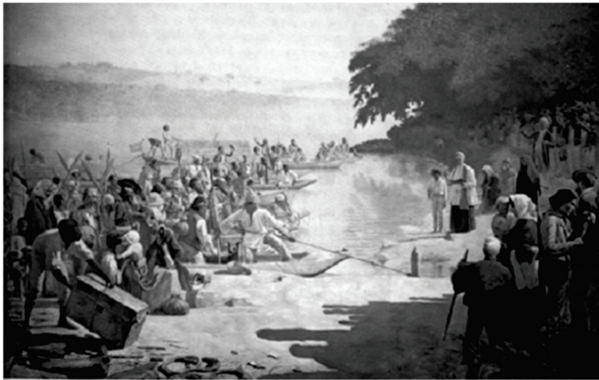
Almeida Junior. Partida da Monção, 1897.

Observe a reprodução do quadro. A partir dele: