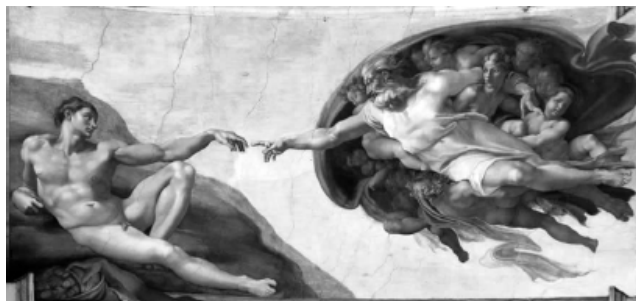
(Michelangelo, A criação de Adão. Cerca de 1511. Disponível em: < https://pt.wikipedia.org/wiki/A_Cria%C3%A7%C3%A3o_de_Ad%C3%A3o >. Acesso em: 2 set. 2022.)

4. (UNICENTRO 2023) Observe a imagem a seguir.