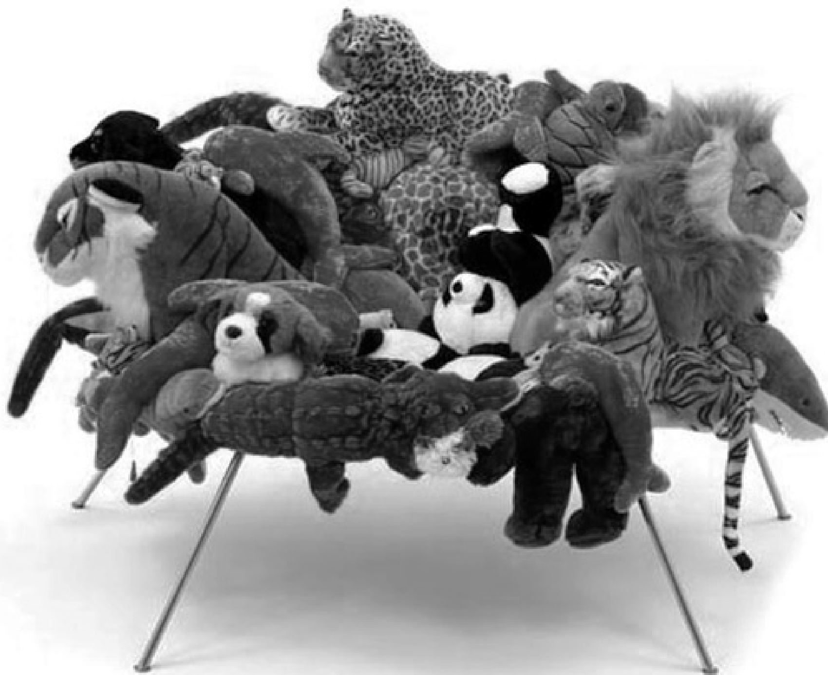
Irmãos Campana. Poltrona banquete.

Quando pouco se falava em sustentabilidade, os irmãos Campana a conjugaram com um espírito inovador e inconformista e se lançaram no mundo do design criando, em 1989, o Estúdio Campana, cuja especialidade era mobiliário. Hoje, são os designers brasileiros de maior destaque na atualidade. Seus trabalhos atualmente não se restringem mais a móveis. As obras dos irmãos recorrem à reutilização de matérias cheias de significados ligados à cultura brasileira — como a cor e a referência folclórica.