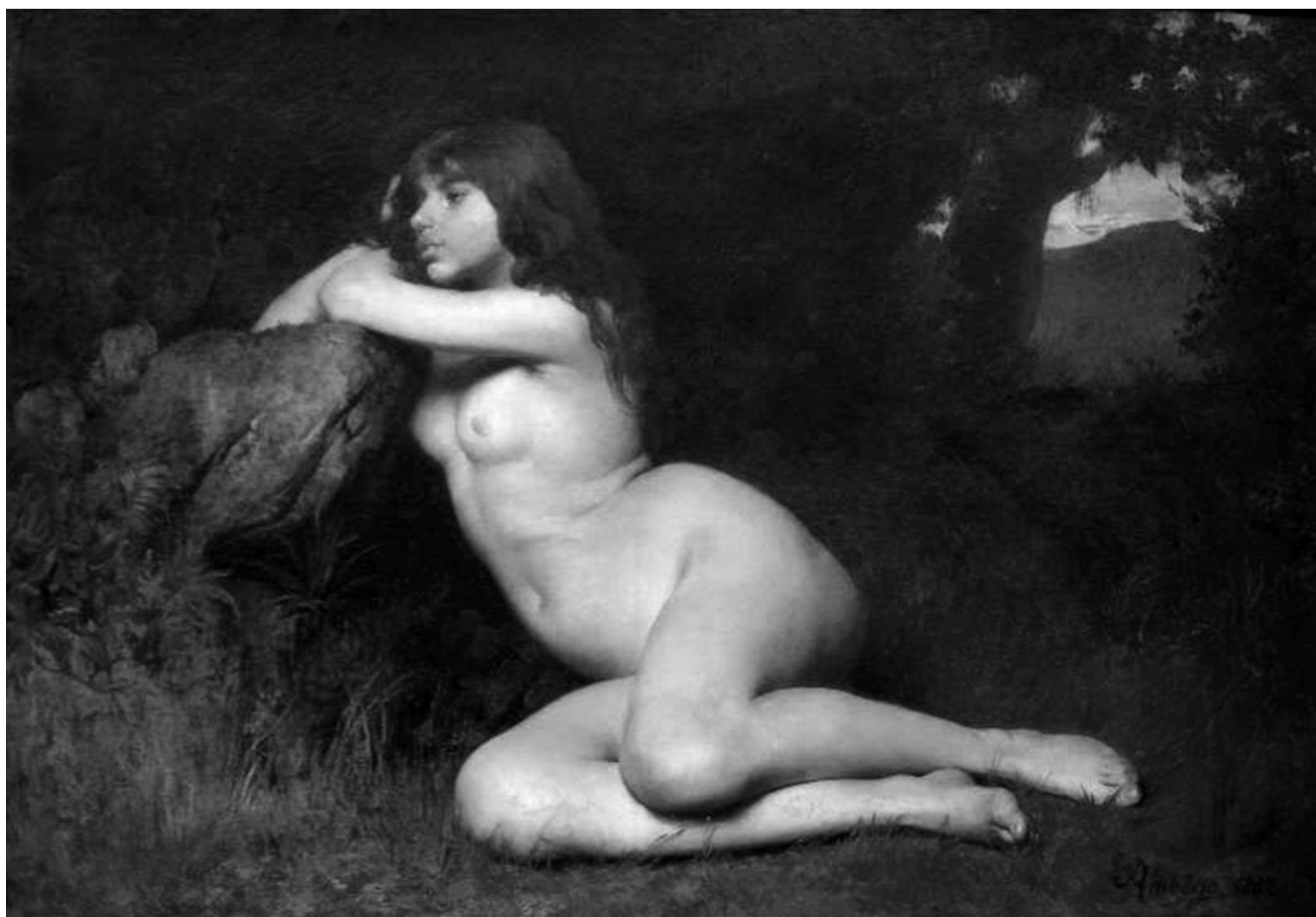
Rodolpho Amoêdo. Marabá , 1882, óleo sobre tela, 151,5 cm × 200,5 cm, Museu Nacional de Belas Artes, Rio de Janeiro.

27 Para o desenvolvimento de peças exclusivas e dignas de exposição artística, os irmãos Campana, conforme exemplificado na figura, recorrem a materiais reutilizáveis — como plástico bolha, cordas e bonecos de pelúcia —, para o design de móveis preenchidos de ressignificação de objetos utilitários.