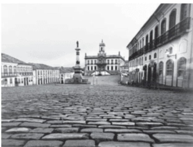
d. Conjunto arquitetônico e urbanístico da cidade de Ouro Preto (MG)