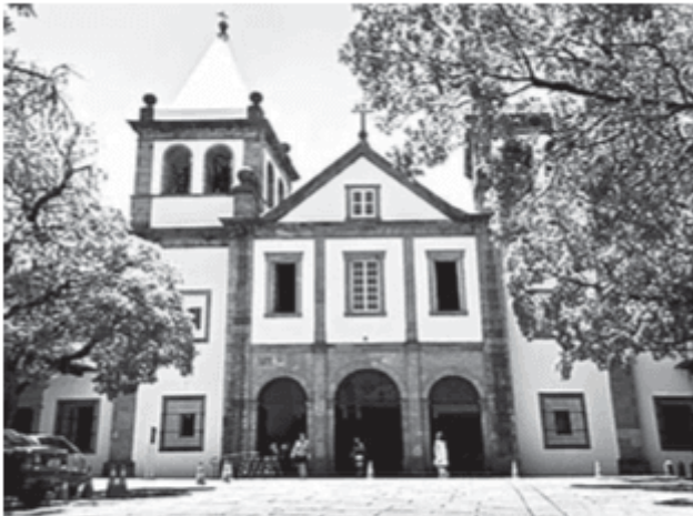
a. Mosteiro de São Bento (RJ)

Entre os bens que compõem o patrimônio nacional, o que pertence à mesma categoria citada no texto está representado em: