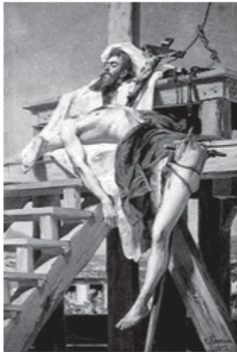
b. Tiradentes esquartejado (1893), de Pedro Américo