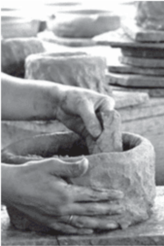
c. Ofício das panelleiras de Goiabeiras (ES)