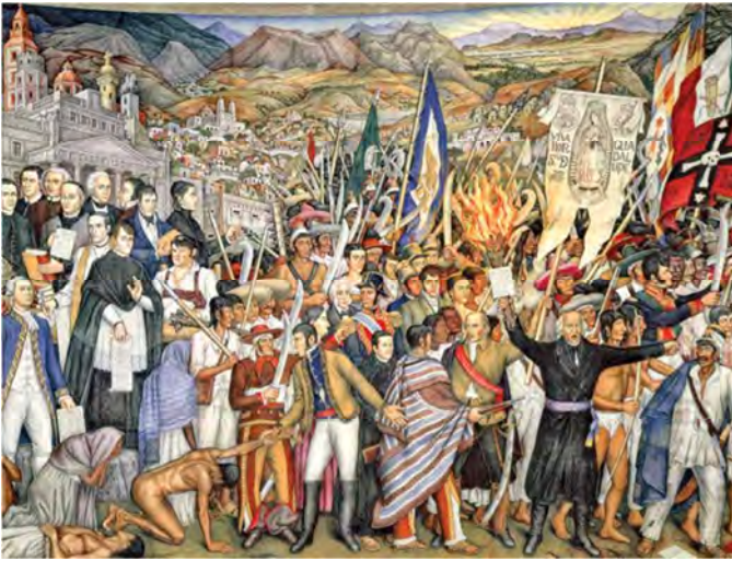
Juan O'Gorman, Retábulo da Independência , pintura mural, 1960-1961 (detalhe).

A imagem acima é representativa do movimento muralista mexicano, que, entre outras características, explorou temas da História do México. Nesse detalhe, é possível identificar a