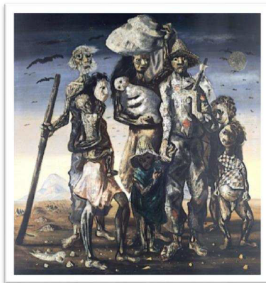
PORTINARI, Cândido. Os retirantes. 1944.

Vejam que imagem profunda essa de Cândido Portinari, que riqueza de detalhes, que feições nos rostos dos personagens, que descrição em detalhes! É uma imagem que diz muito sobre uma realidade brasileira: a seca!