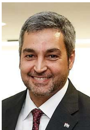
Mario Abdo Benítez