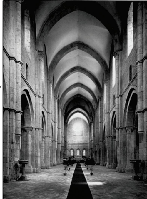
Abadia de Fossa Nova (Itália). interior. iniciada em 1187 e consagrada em 1208.