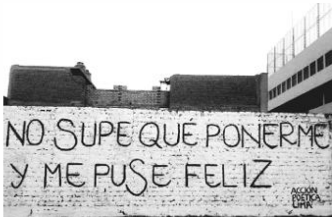
ACCIÓN POÉTICA LIMA. Disponível em: https://twitter.com . Acesso em: 30 maio 2016.

Nesse grafite, realizado por um grupo que faz intervenções artísticas na cidade de Lima, há um jogo de palavras com o verbo poner . Na primeira ocorrência, o verbo equivale a “vestir uma roupa”, já na segunda, indica