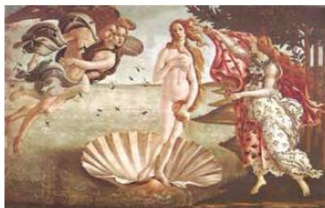
(Sandro Botticelli, "O nascimento de Vênus", 1485. In: E. H. Gombrich, A História da Arte , 1993.)

A pintura "O nascimento de Vênus" apresenta os seguintes princípios culturais do Renascimento nas artes plásticas: