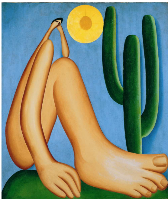
Abaporu, Tarsila do Amaral.

A Comente e explique o significado das imagens do quadro Abaporu .