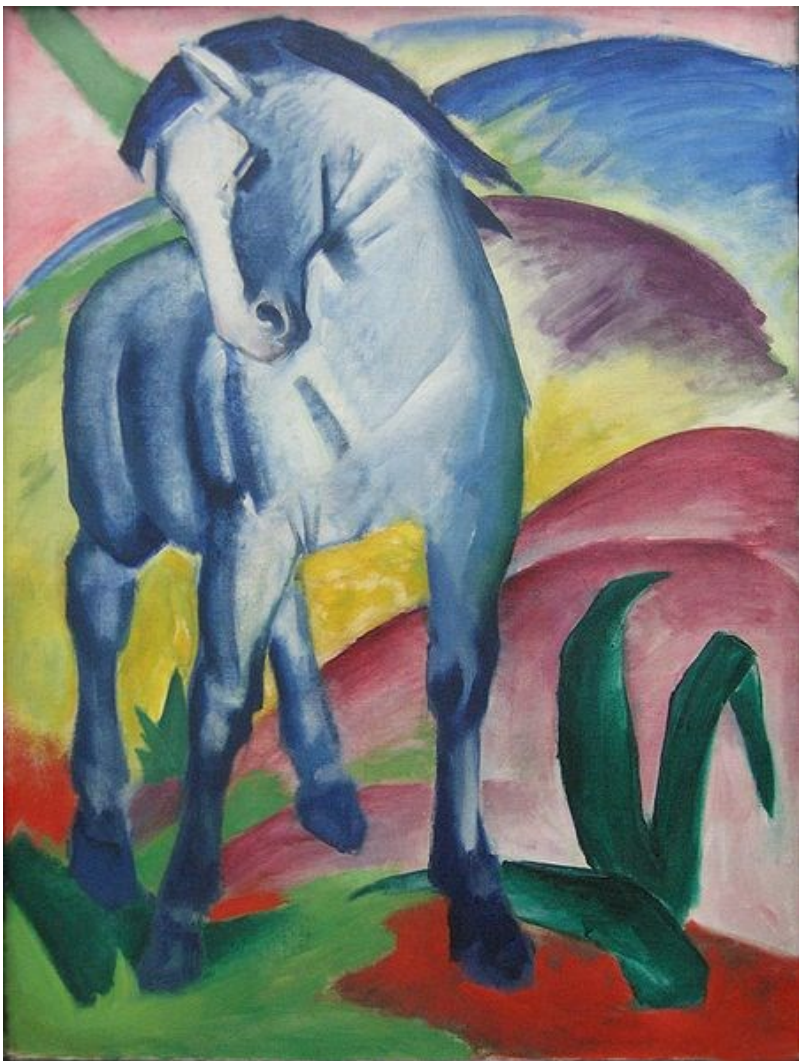
Franz Marc – Cavalo Azul (1911)

https://de.wikipedia.org/wiki/Franz_Marc#/media/File:Franz_Marc_Blaues_Pferd_1911.jpg