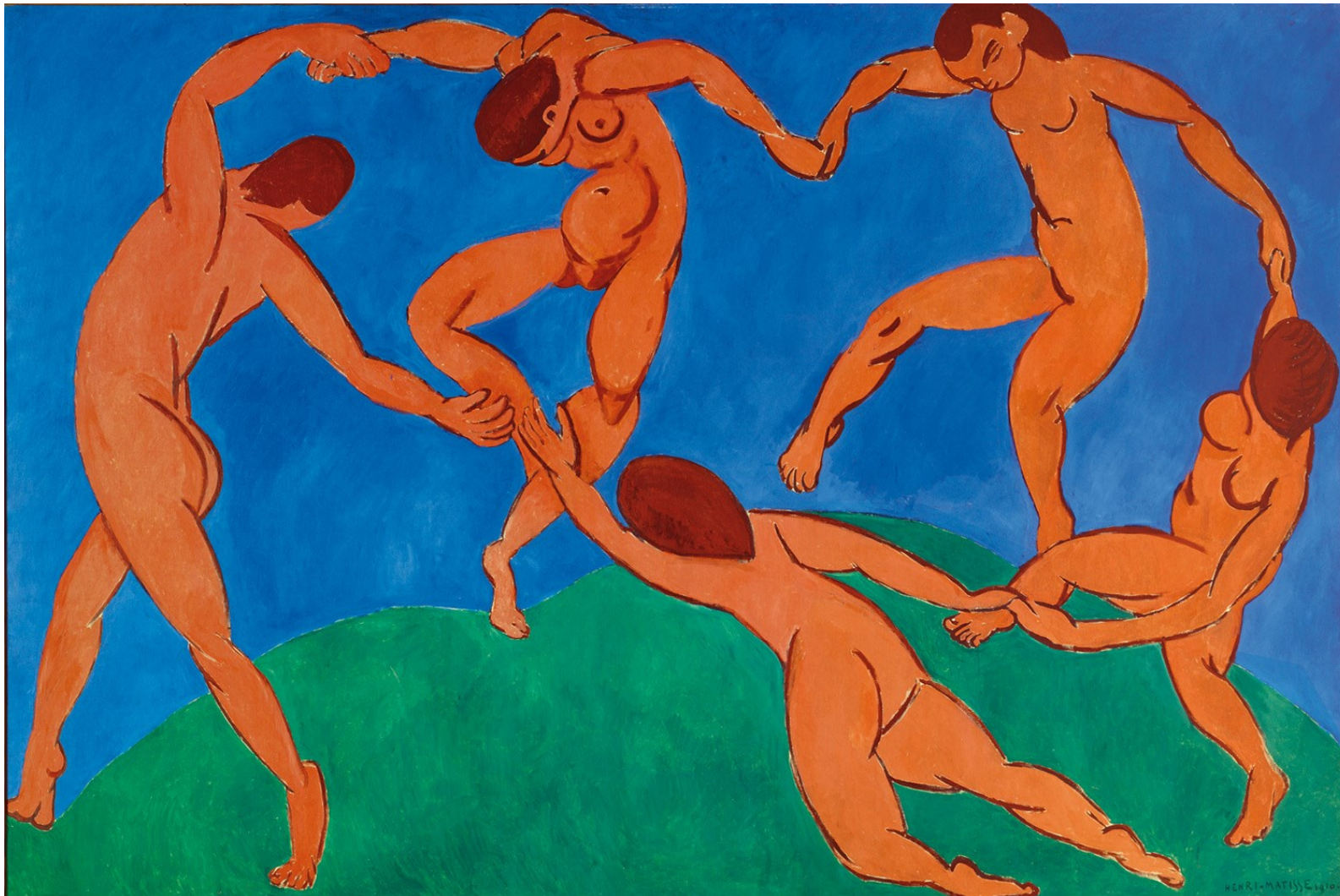
Henry Matisse – A Dança (1909)

http://galeriadefotos.universia.com.br/uploads/2012_04_04_23_39_110.jpg