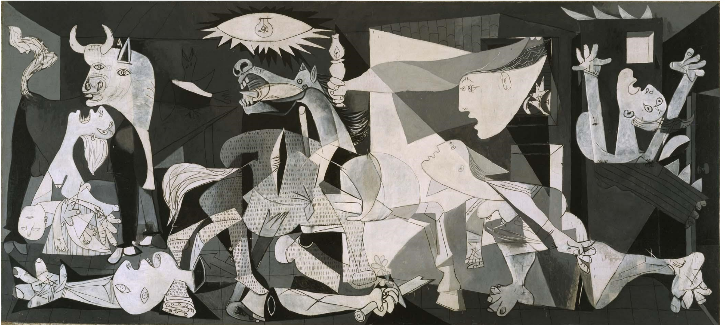
Pablo Picasso – Guernica (1937)

http://lounge.obviousmag.org/mosaico/2015/04/guernica---78-anos-historia-e-desdobramentos.html.jpg?v=20151117195945