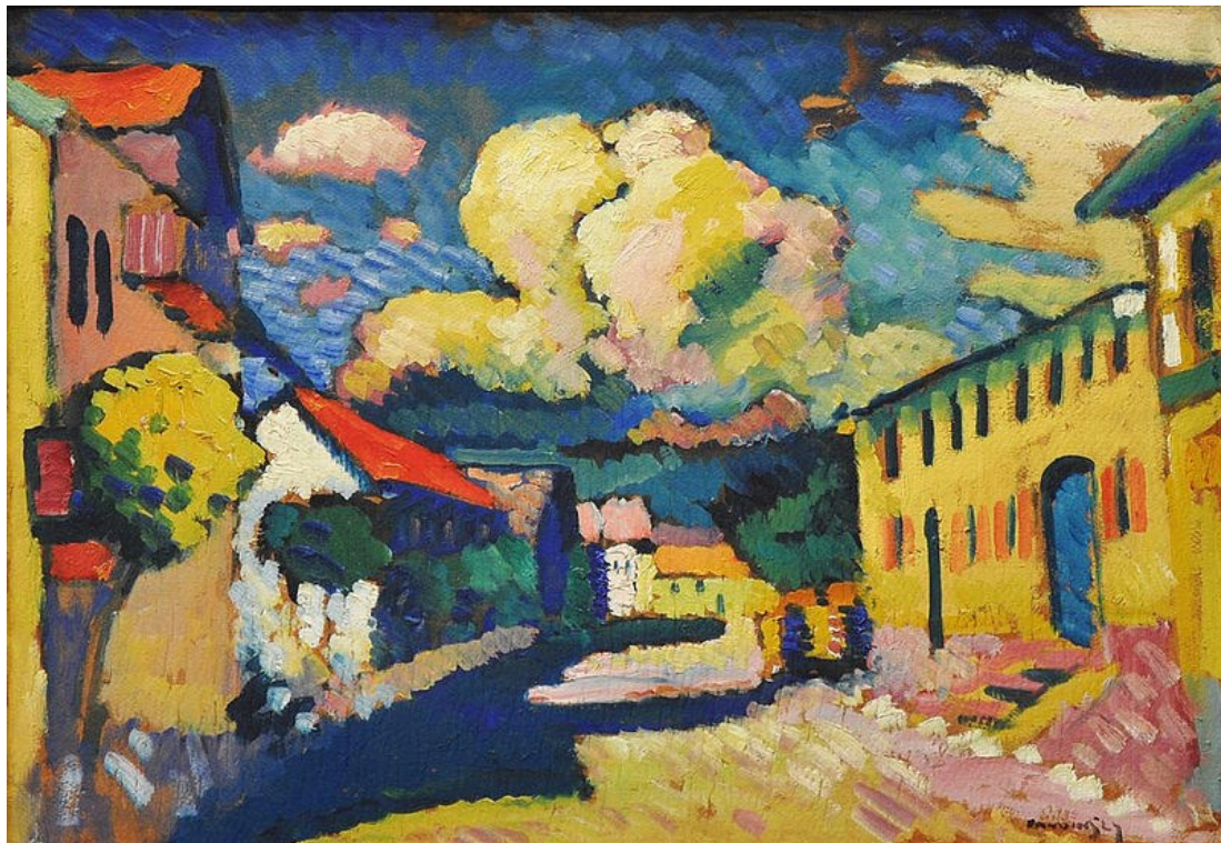
Wassily Kandinsky – Munau, rua do vilarejo (1908)

https://de.wikipedia.org/wiki/Datei:Vassily_Kandinsky,_1908,_Murnau,_Dorfstrasse.jpg