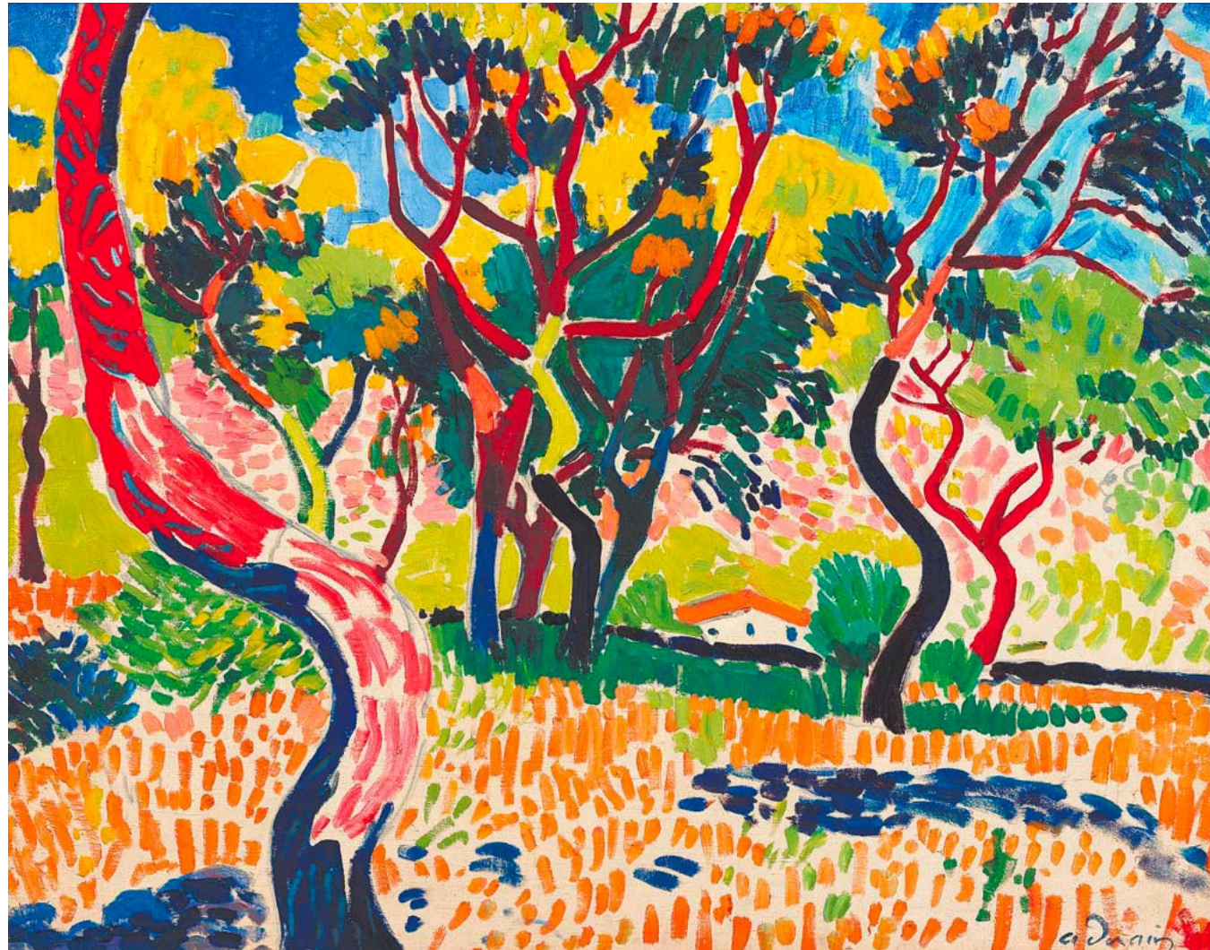
André Derain – Árvores em Collioure (1905) http://newsoftheartworld.com/erich-slomovic-collection-up-for-auction/?lang=en