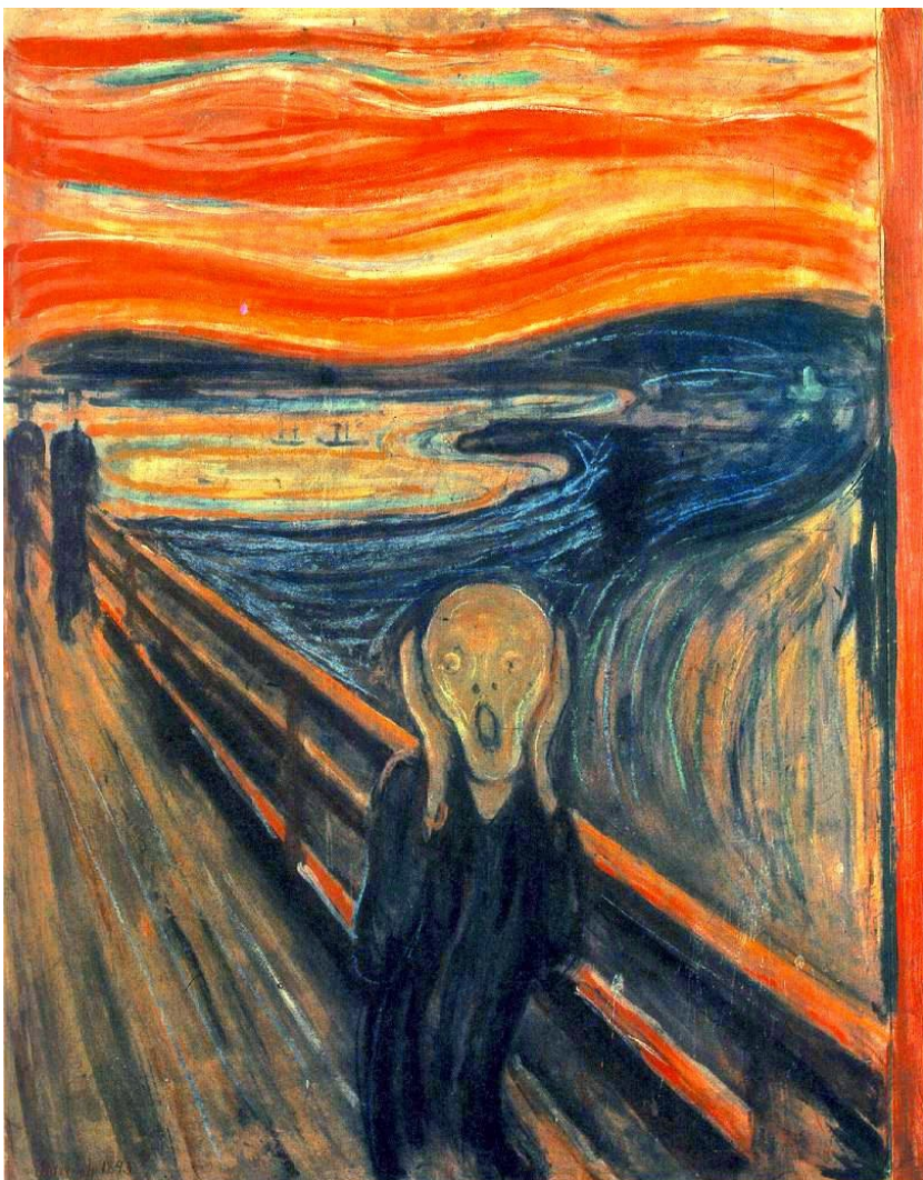
Edvard Munch – O Grito (1893)

http://artefontedeconhecimento.blogspot.com.br/2010/07/o-grito-1893-edvard-munch.html