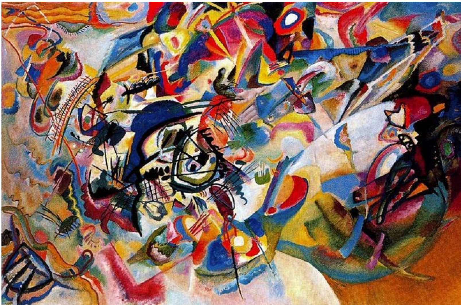
Wassily Kandinsky – Composição 7 (1913)

https://de.wikipedia.org/wiki/Datei:Vassily_Kandinsky,_1913_-_Composition_7.jpg