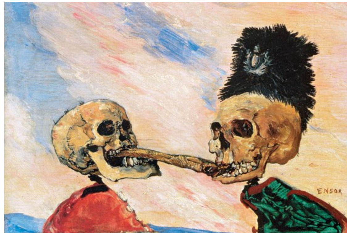
James Ensor – Caveiras brigando por um arenque (1891)

http://artefontedeconhecimento.blogspot.com.br/2010/07/o-grito-1893-edvard-munch.html