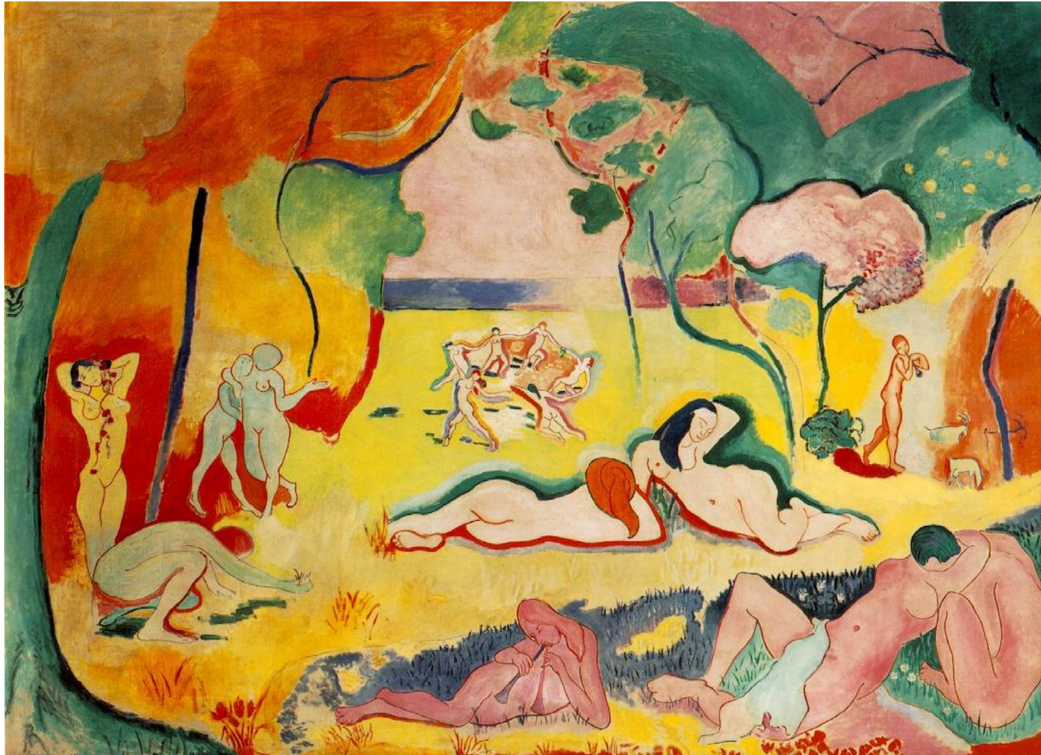
Henry Matisse – Alegria de Viver (1905 - 6)

http://2.bp.blogspot.com/- JXeqL4wnMyE/ToEYphnSxDI/AAAAAAAAABrg/HFN5tMEm9C8/s1600/matisse.jpg