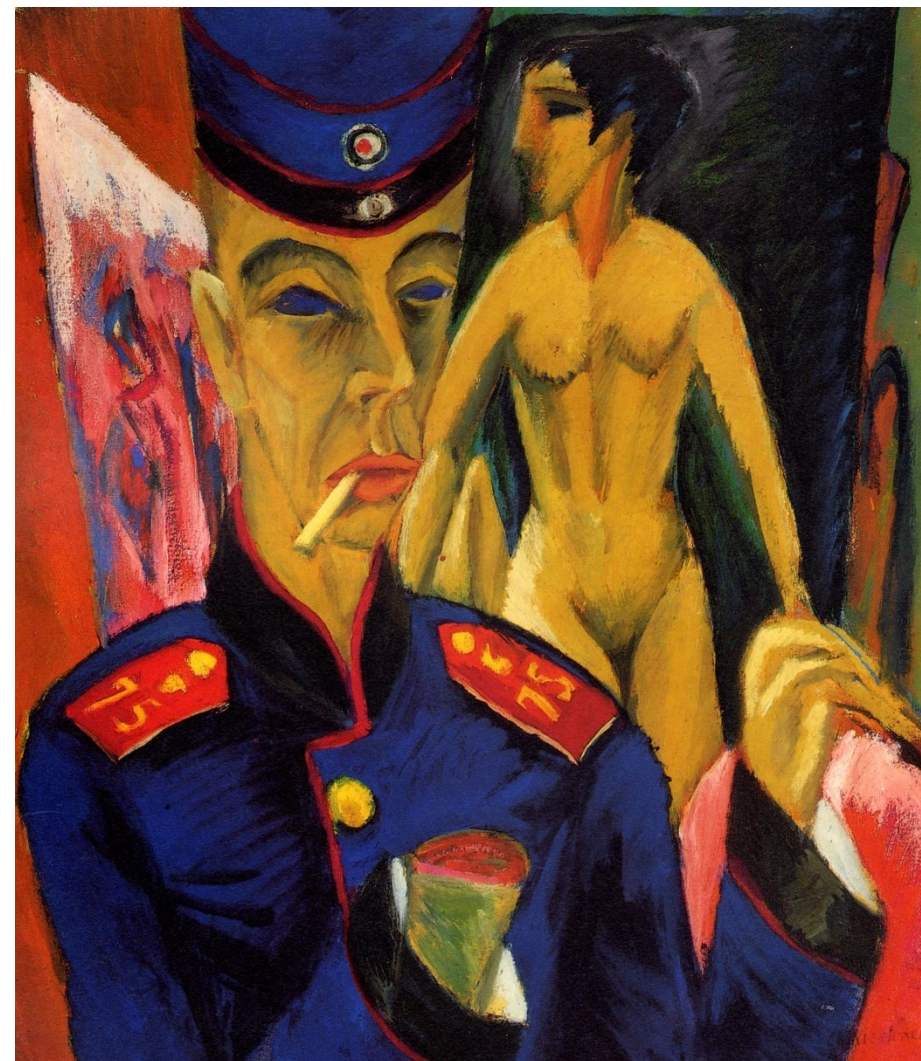
Ernst Luduwig Kirchner – Autorretrato como soldado (1915)

https://de.wikipedia.org/wiki/Franz_Marc#/media/File:Franz_Marc_Blaues_Pferd_1911.jpg