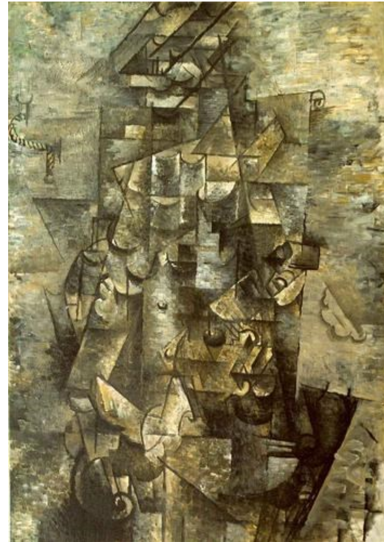
George Braque – Homem com violão (1911)

http://www.pearltrees.com/s/pic/or/les-demoiselles-avignon-1907-55930788