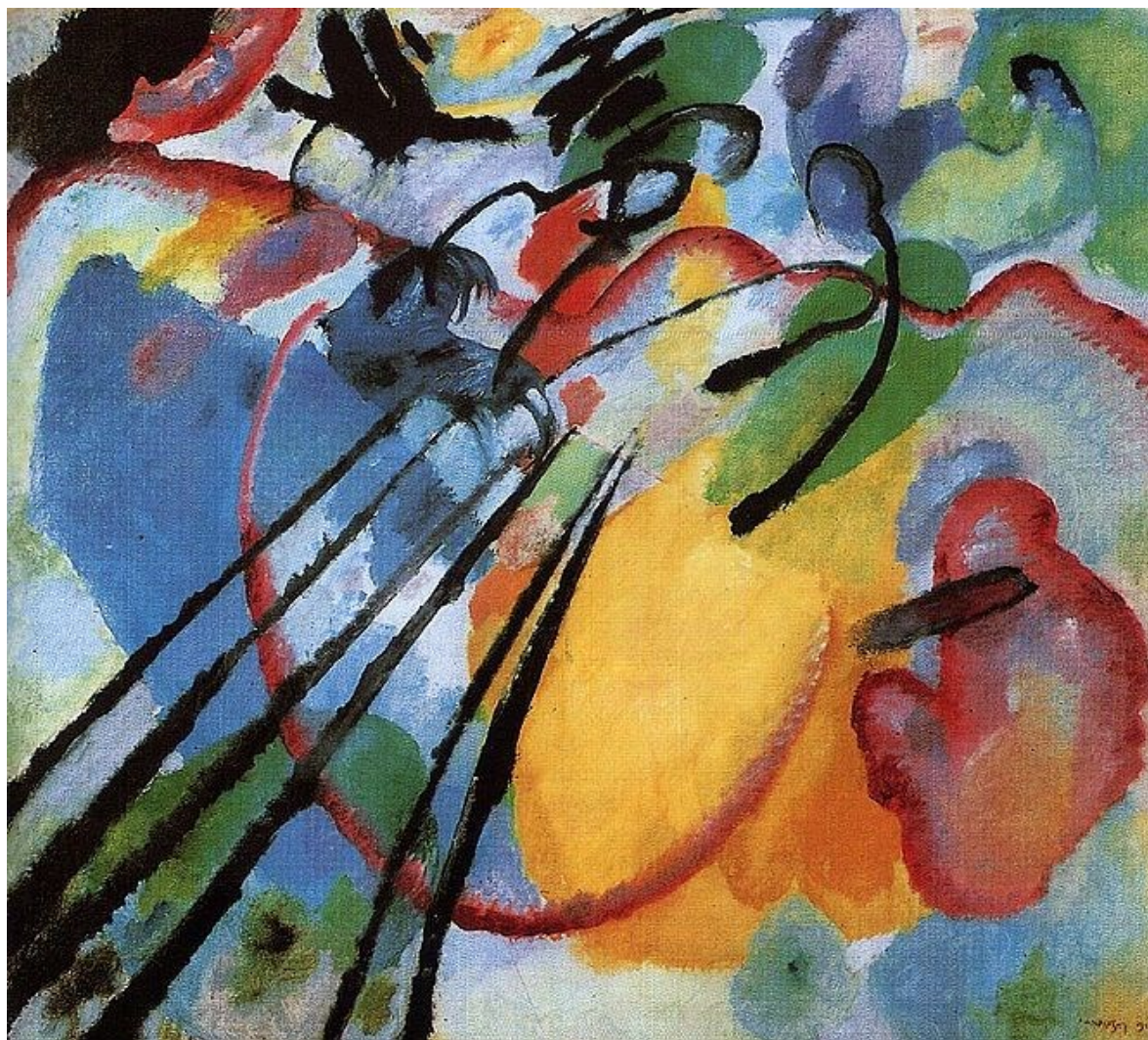
Wassily Kandinsky – Improvisação 26 (1912)

https://de.wikipedia.org/wiki/Datei:Vassily_Kandinsky,_1908,_Murnau,_Dorfstrasse.jpg