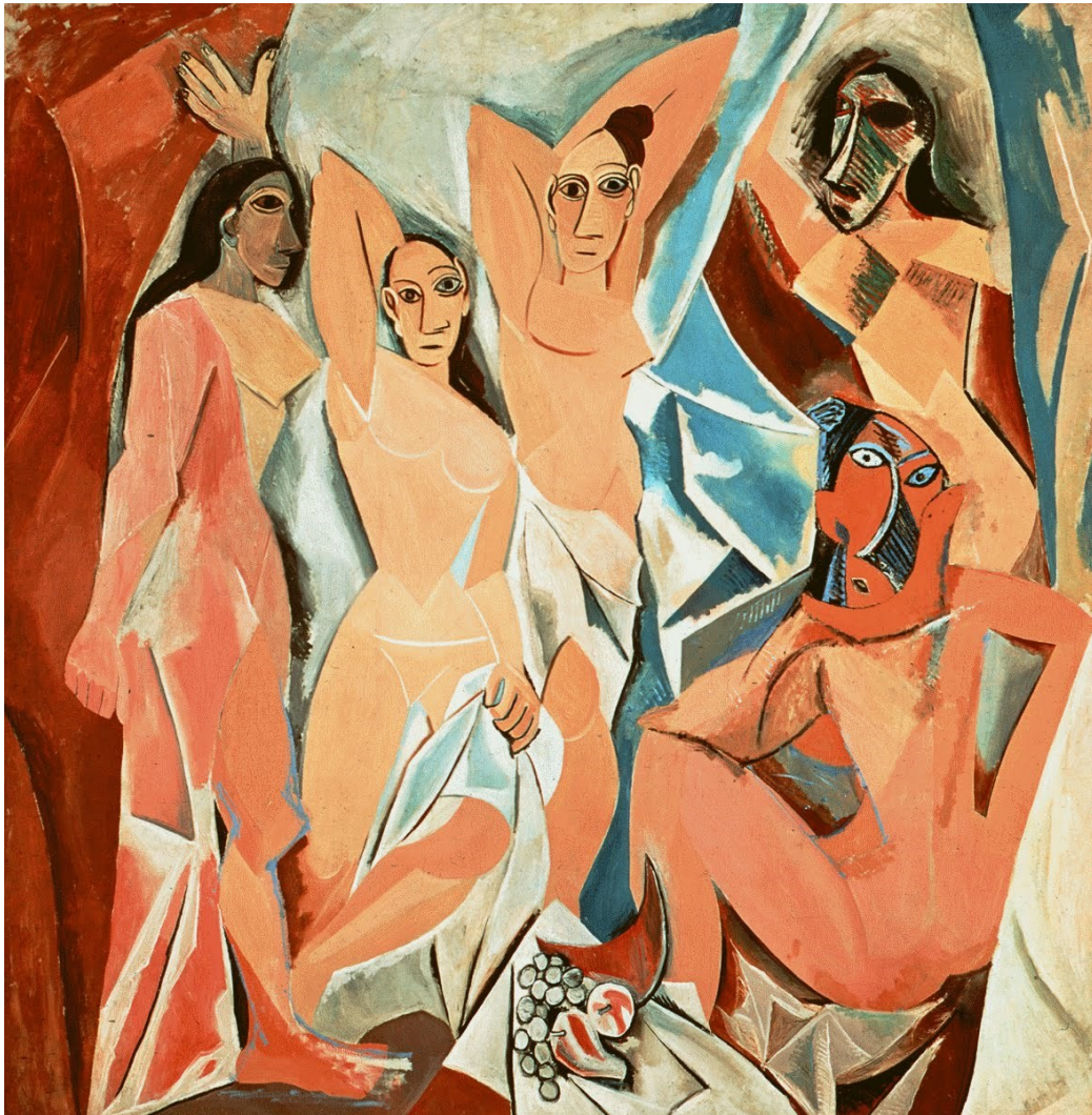
Pablo Picasso - Les demoiselles d'Avignon (1907)

http://www.pearltrees.com/s/pic/or/les-demoiselles-avignon-1907-55930788