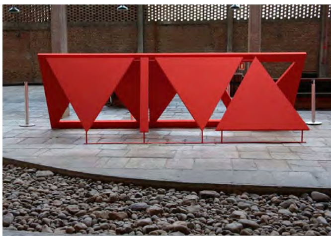
II - Escultura em aço feita sob a supervisão de A. de Campos, 2016

Com relação às dimensões da poesia concreta apresentadas nas figuras I e II, assinale V para a afirmação verdadeira e F para a falsa.