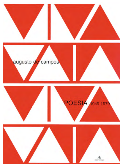
Capa do livro Viva Vaia de Augusto de Campos

50 Viva Vaia é um poema concreto publicado em 1972 e dedicado ao compositor Caetano Veloso, que havia sido vaiado por grande parte do público presente ao Teatro Tuca, no Festival Internacional da Canção de 1968. Desde então, em diversos momentos, o poema é utilizado com intuito de dar significação a episódios da cena política e cultural brasileira.