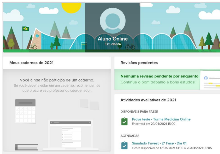
Figura 4: Atividades avaliativas

Para acessar a prova procure a opção “Atividades Avaliativas”.