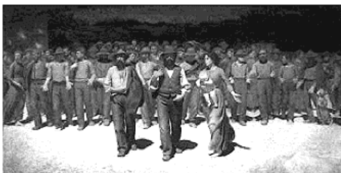
Fonte: SCOTTI, A. Il Quarto Stato di Giuseppe Pellizza da Volpedo. Milano: TEA Arte, 1998.

O quadro abaixo, criado pelo italiano Giuseppe Pellizza, é uma expressiva representação da emergência dos movimentos sociais no final do século XIX, ao mostrar uma multidão de trabalhadores que, determinadamente, avança para reivindicar seus direitos. Esse fenômeno de desenvolvimento das organizações coletivas, como o movimento sindical e os partidos políticos, teve início na Europa e Estados Unidos do século XIX, espalhando-se por todo o mundo ocidental.