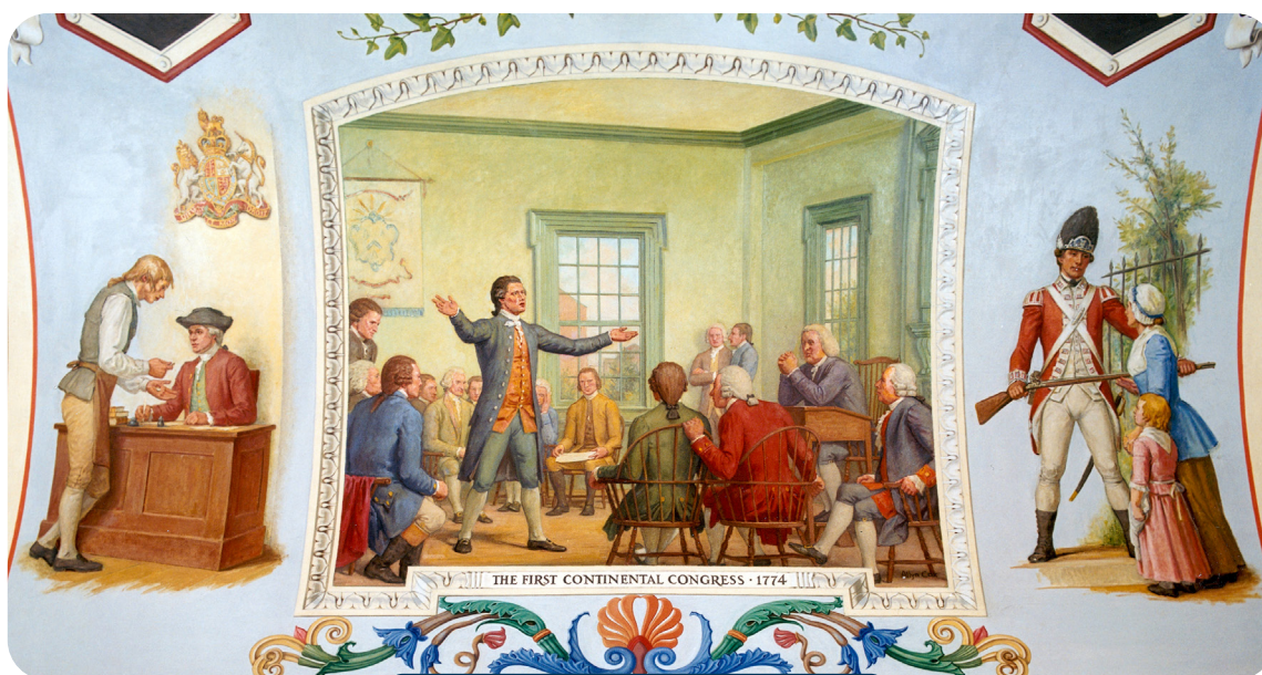
Primeiro Congresso da Filadélfia – 1774

A reação dos colonos foi convocar o Primeiro Congresso da Filadélfia, que buscou discutir como eles responderiam às provocações dos britânicos. Nesse primeiro congresso ficou decidido que os colonos redigiriam um documento pedindo para a Inglaterra abrandar essas imposições. Por sua vez, a reação britânica foi aumentar o número de soldados nas colônias.