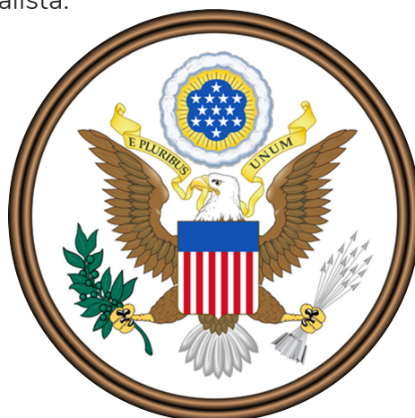
Grande Selo dos Estados Unidos

Por fim, em 1783, Estados Unidos e Inglaterra assinaram um acordo de paz e cessaram a guerra através do Tratado de Paris. Em 1787, os Estados Unidos da América elaboraram a sua primeira constituição, estabelecendo para a nova nação a forma republicana de governo e o sistema federalista.