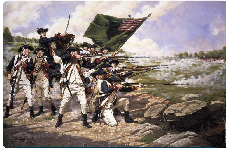
Soldados americanos lutando na Batalha de Long Island, de 1776.