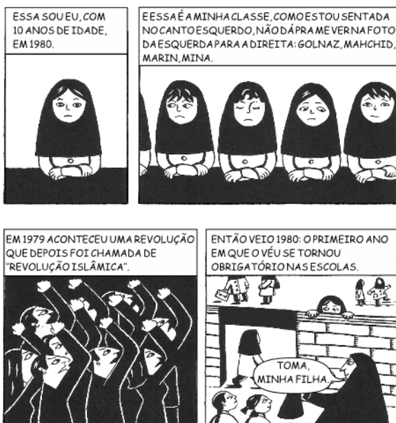
SATRAPI, M. Persépolis. São Paulo: Cia. das Letras, 2007 (adaptado)

A memória recuperada pela autora apresenta a relação entre