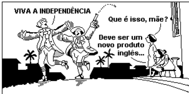
(Miguel Paiva e Lilia Moritz Schwarcz. "Da Colônia ao Império". São Paulo: Brasiliense, s/d. p. 84.)

Na visão do cartunista, a Independência do Brasil, ocorrida em 1822,