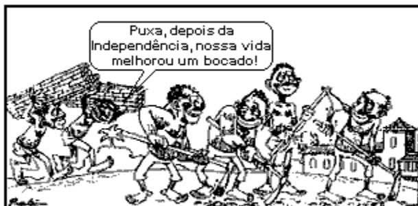
(Fonte: SCHIMIDT, M. "História crítica no Brasil." São Paulo: Nova Geração, s.d.p.90.)

59. (Ufrs) A partir da gravura a seguir, é possível afirmar que, logo após a emancipação política do Brasil.