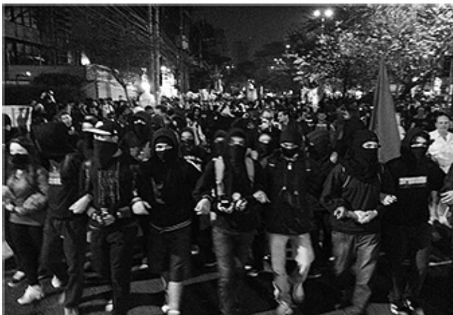
Foto de manifestação de Black Bloc em São Paulo, 11/07/2013.