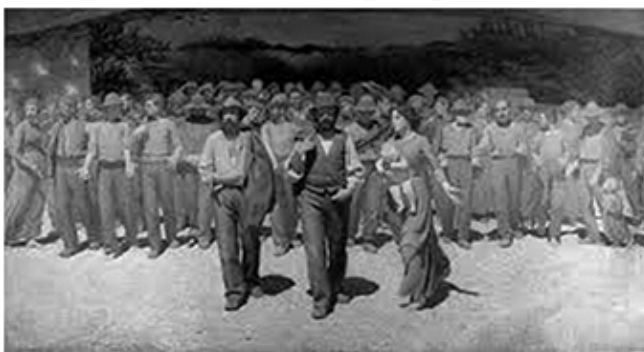
“O quarto estado”, obra do italiano Giuseppe Pellizza (1868 - 1907)