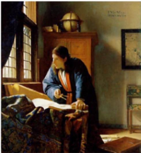
The Geographer, Johannes Vermeer, datada de 1668-1669.

O que o geógrafo olha está fora e não sabemos o que sua visão encontra, mas o pintor parece dizer que mira-se o mundo e o mundo refletido na retina de quem olha se derrama com a luz do sol pelo diminuto ambiente de trabalho. A metáfora em cores quentes parece nos dizer que o papel do geógrafo está nessa busca de compreender o vasto mundo para o qual se olha, e que ele representa sempre de maneira muito limitada nos mapas, nos globos, nos atlas.