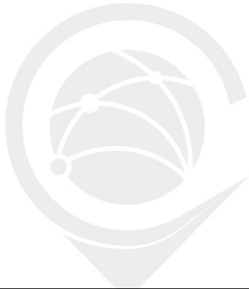
Gráfico da transição: