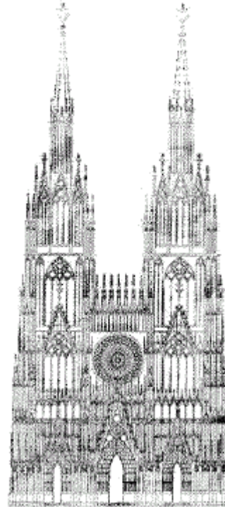
Catedral de Estrasburgo.