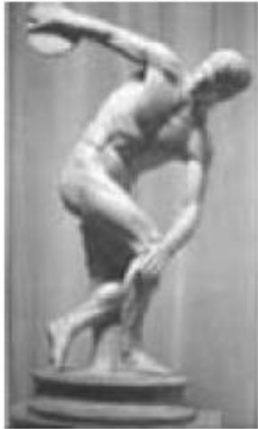
Egito antigo: clássica. Míron: Discóbolo. cerca de 450 a.C. Sentado. século XXVI a.C.