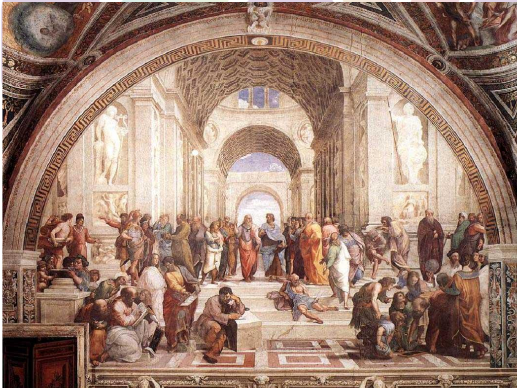
Escola de Atenas, de Rafael.