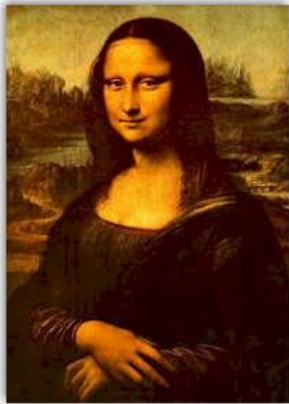
Monalisa, de Da Vinci. Disponível em: www.esoterikha.com .