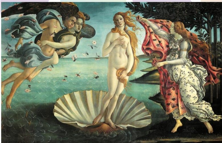
O nascimento de Vênus, de Botticelli. Disponível em: en.wikipedia.org .