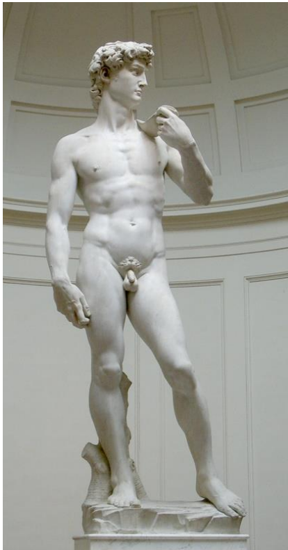
Davi, de Michelangelo.