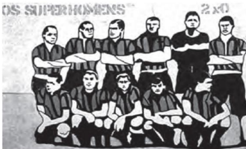
GERCHMAN, R. Superhomens . ALENCAR, V. P. Cultura popular e crítica .