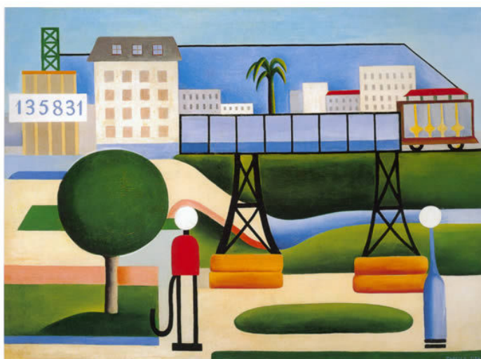
Tarsila do Amaral, São Paulo . Óleo sobre tela, 1924. Pinacoteca do Estado de São Paulo.

2 Tarsila do Amaral foi uma das expoentes do movimento modernista no Brasil. Observe atentamente a imagem abaixo e depois responda às questões propostas.