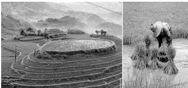
AGRICULTURA DE JARDINAGEM