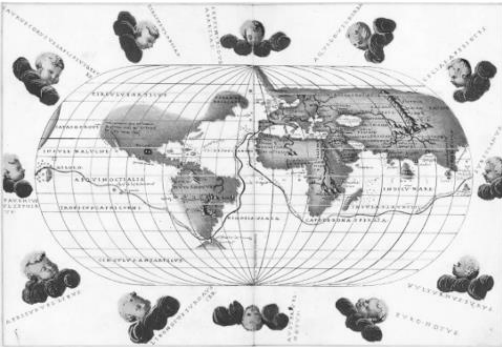
Battista Agnese, Atlas Portulano , 1545, Biblioteca Digital Mundial. Disponível em https://www.wdl.org/pt/ .

5. (Fuvest 2020) A representação cartográfica a seguir refere-se à viagem de circunavegação, iniciada em Sanlúcar de Barrameda, na Andaluzia, em 20 de setembro de 1519, e comandada pelo português Fernão de Magalhães, a serviço da monarquia da Espanha. A despeito da repercussão da viagem para o desenvolvimento dos conhecimentos náuticos e para a exploração do Oceano Pacífico, Battista Agnese foi um dos poucos cartógrafos a registrar a empreitada de Magalhães.