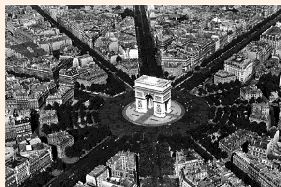
Paris – Arco do Triunfo

11 | Considere a foto para responder à questão.