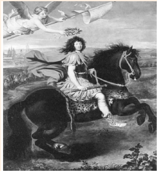
“Luís XIV diante de Maastricht” – Pierre Mignard (1673).