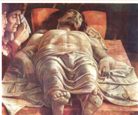
(Andrea Mantegna. Lamentação sobre o Cristo morto , 1480. Pinacoteca de Brera, Milão.)

A pintura representa no martírio de Cristo os seguintes princípios culturais do Renascimento italiano: