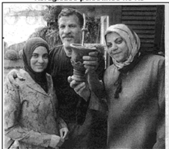
Zero Hora, 21 out, 2007.

Nem as mais de 35 horas de viagem, nem o céu nebuloso de Porto Alegre. Nada tirou o sorriso de satisfação do rosto dos 10 refugiados palestinos que chegaram ontem à tarde ao Rio Grande do Sul.