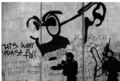
O muro construído por Israel na Cisjordânia lembra também os guetos judeus na Segunda Guerra Mundial Le Monde Diplomatique Brasil, ago. 2009.

A articulação da frase e da charge com a realidade expressa na foto permite identificar uma prática da sociedade no espaço geográfico.