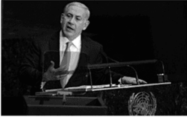
Benjamin Netanyahu, primeiro ministro israelense

( http://ultimosegundo.ig.com.br/mundo/discurso-na-onu-elevapopularidade-de-netanyahu-em-israel/in1597240729755.html )