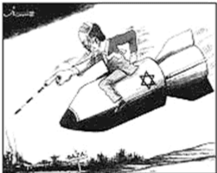
Courrier International , n.º 66, 2006.

A charge, publicada em 07.07.2006, faz alusão à