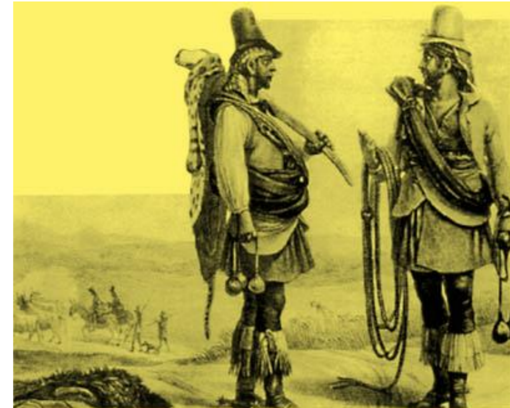
No Sul, alguns índios tomaram-se cavaleiros que prestavam serviços nas estâncias de criação de gado.