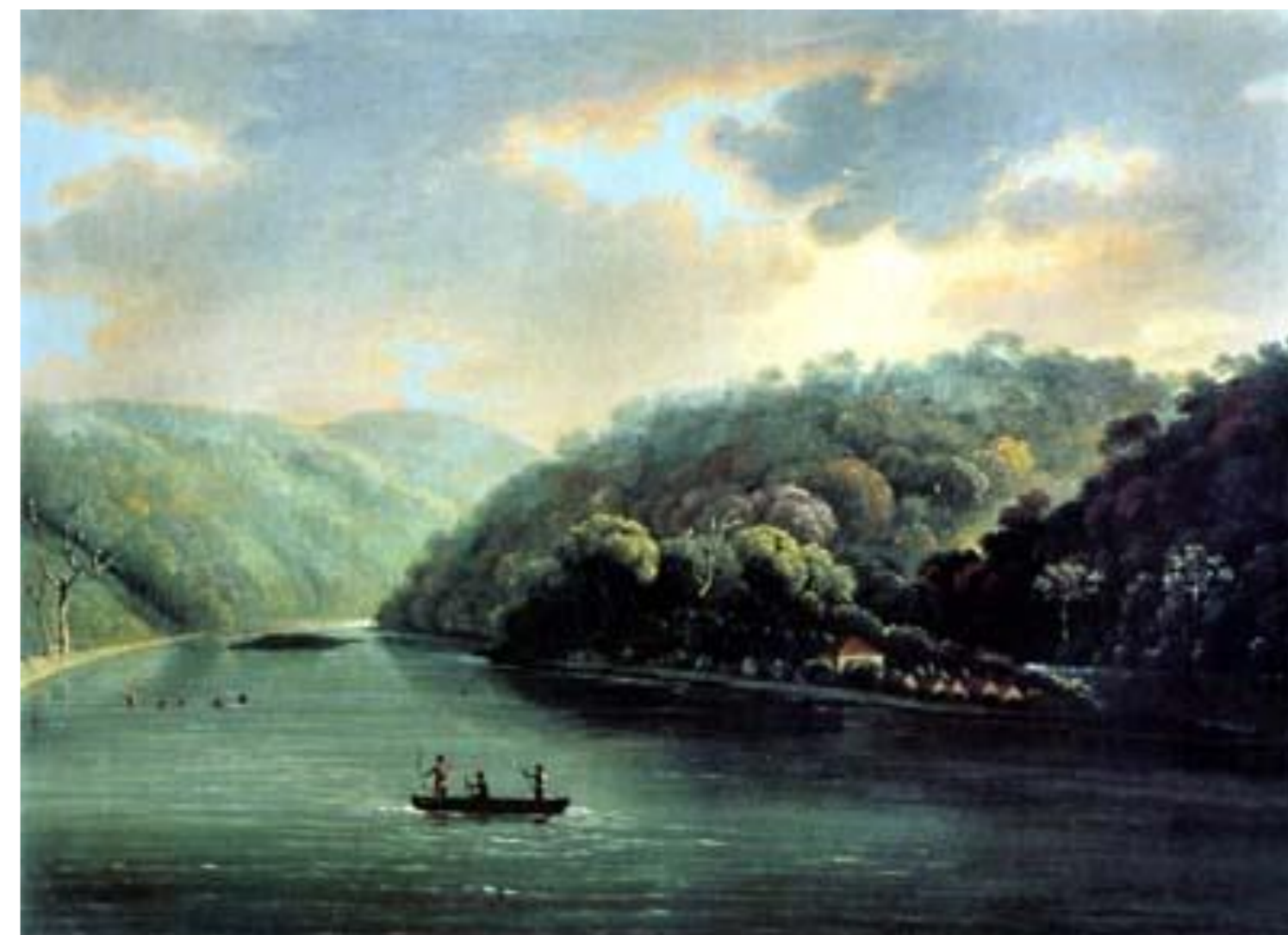
Johann Bachta, Paisagem freqüentada pelos Cabanos durante o movimento, século XIX.