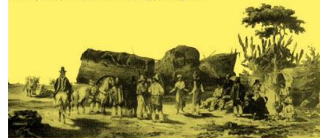
Cena cotidiana na Região do Rio da Prata, Biblioteca Nacional, RJ.