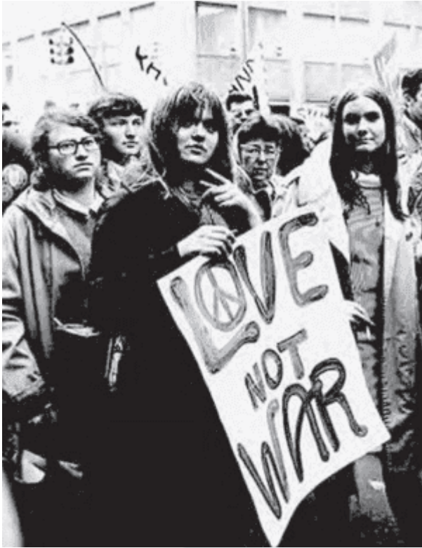
Foto de Jovens em protesto contra a Guerra do Vietnã.

Nos anos que se seguiram à Segunda Guerra, movimentos como o Maio de 1968 ou a campanha contra a Guerra do Vietnã culminaram no estabelecimento de diferentes formas de participação política. Seus slogans, tais como “Quando penso em revolução quero fazer amor”, se tornaram símbolos da agitação cultural nos anos 1960, cuja inovação relacionava-se