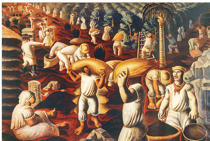
“Café” (1935), de Candido Portinari