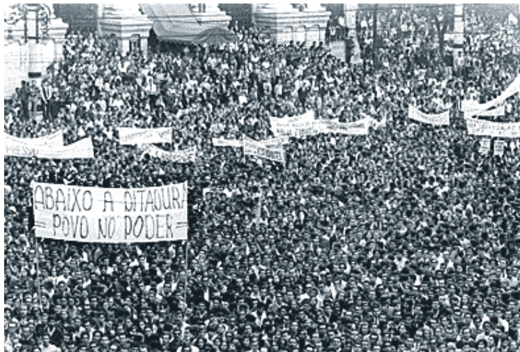
Passeata dos Cem Mil, Rio de Janeiro, 26/06/1968