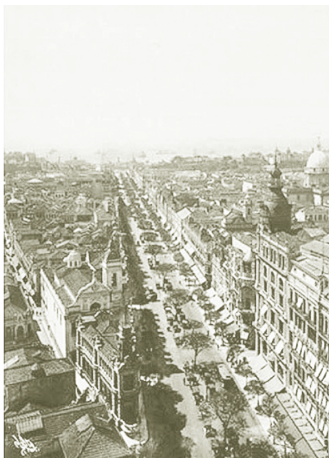
Av. Rio Branco, Rio de Janeiro, década de 1920