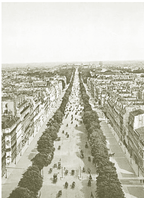
Avenue des Champs Élysées, Paris, 1900