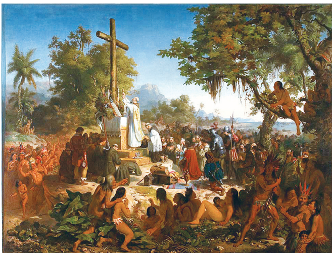
“Primeira missa no Brasil” (1860), de Victor Meirelles

Observe as obras de pintores brasileiros reproduzidas abaixo. A primeira se insere no contexto do Romantismo, no século XIX, e a segunda no do Modernismo, no século XX, movimentos culturais que difundiram características e símbolos distintos para a identidade nacional.