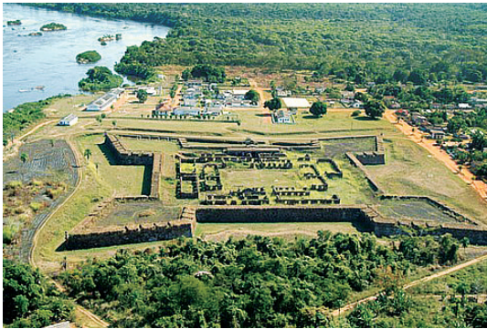
Fotografia das ruínas do Real Forte do Príncipe da Beira