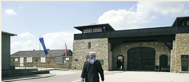
Ex-prisioneiro caminha em direção ao memorial de Mauthausen

Um novo memorial foi inaugurado no campo de concentração nazista de Mauthausen, na Áustria, com a presença de três chefes de Estado: o austríaco Heinz Fischer, o húngaro Janos Ader e o polonês Bronislaw Komorowski, além da ministra israelense da Justiça, Tzipi Livni. O novo memorial – “Mauthausen, lugar de um crime” – inclui duas exposições que revelam o dia a dia do campo de concentração através de entrevistas com 48 sobreviventes. No total, duzentas mil pessoas, procedentes de quarenta países, incluindo cerca de cinquenta mil judeus, foram detidas até 1945 em Mauthausen. Ao menos noventa mil morreram devido ao extenuante trabalho nas minas de granito, à má nutrição, às doenças e às execuções.