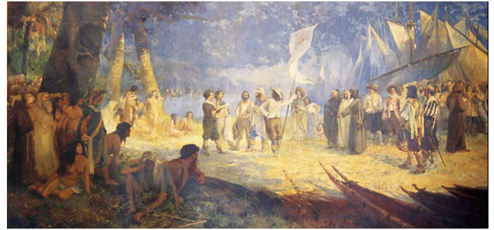
Tela "Conquista do Amazonas" (1907), de Antonio Parreiras