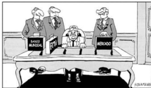
Jota; Joly; Reineri, 2004.

Harvey, David. O neoliberalismo, história e implicações . São Paulo: Edições Loyola, 2008.