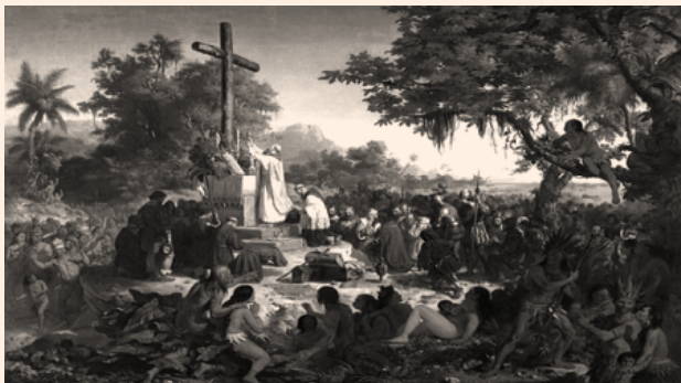
Victor Meirelles. A Primeira Missa no Brasil , 1860. Óleo sobre tela, 268 × 356cm. Museu Nacional de Belas Artes, Rio de Janeiro.

A primeira missa no Brasil é um momento emblemático do início da colonização portuguesa na América, celebrada poucos dias após a chegada e desembarque dos portugueses na costa brasileira, imortalizada pela narrativa na Carta de Pero Vaz de Caminha e no óleo sobre tela de Victor Meirelles. A ocupação de fato demorou um pouco mais a acontecer, dentre as razões para seu início, temos