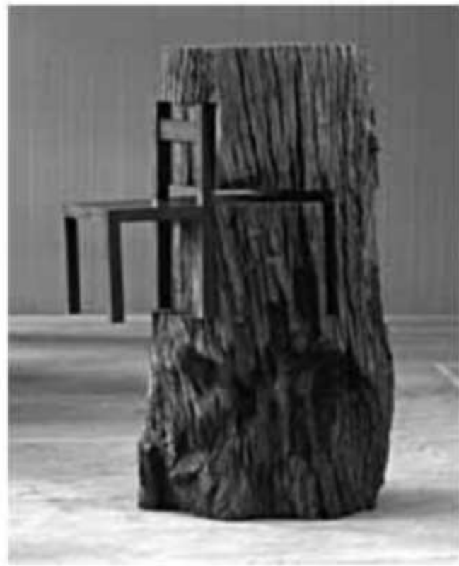
Leirner, N. Tronco com cadeira (detalhe), 1964. Disponível em: http://www.itaucultural.org.br . Acesso em: 27 jul. 2010.

Nessa estranha dignidade e nesse abandono, o objeto foi exaltado de maneira ilimitada e ganhou um significado que se pode considerar mágico. Daí sua “vida inquietante e absurda”. Tornou-se ídolo e, ao mesmo tempo, objeto de zombaria. Sua realidade intrínseca foi anulada.