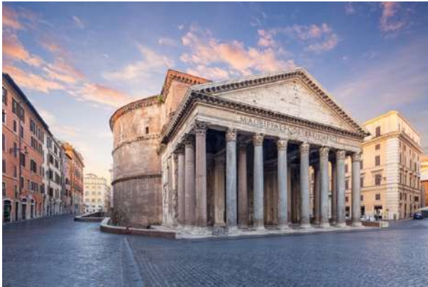
Pantheon (Roma, séc. II a. C.)