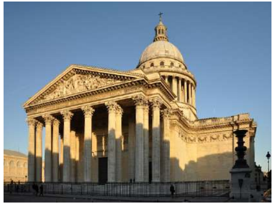
Panthéon (Paris, séc. XVIII)

Helena: “Era uma moça de 16 a 17 anos, delgada sem magreza, estatura um pouco acima de mediana, talhe elegante e atitudes modestas. (...) As linhas puras e severas do rosto parecia que as traçara a arte religiosa. Se (...) os olhos alçassem as pupilas ao céu, disséreis um daqueles anjos adolescentes (...)”.