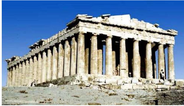
Partenon (Atenas, séc. V a. C.)