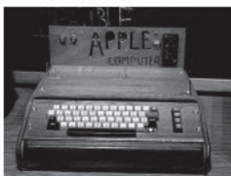
O Apple-I, um dos primeiros computadores pessoais, fabricado em 1976