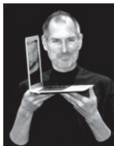
Steve Jobs, um dos criadores da empresa Apple, em 2008

Com o intenso desenvolvimento da tecnologia no mundo contemporâneo, diversos produtos tomam-se rapidamente ultrapassados.