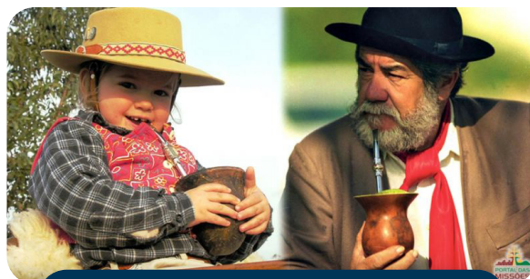
Tomar chimarrão, um costume que atravessa gerações na região sul do Brasil

► (a) Ação tradicional: trata-se de uma ação que é resultado de um costume ou de uma prática reiterada, geralmente transferida de geração para geração. Essa ação pode ou não fazer sentido. Em alguns casos, ela pode se dar somente pela repetição.