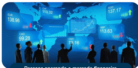
Pessoas operando o mercado financeiro

► (c) Ação racional com relação a fins: é aquela que surge de um cálculo racional. Determina-se um fim, que deve ser buscado racionalmente, organizando-se os meios necessários. Geralmente pode ser observada no mercado, em decisões que envolvem a economia.