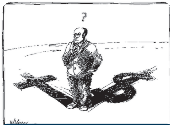
A ética protestante e o capitalismo segundo Weber

Weber entende que algo na cultura e na sociedade ocidentais ajudavam a explicar o surgimento e o desenvolvimento do capitalismo, já que a Revolução Industrial tinha se dado, até então, apenas nos países ocidentais. A partir de seu estudo, ele identifica que existiam algumas semelhanças entre algumas ideias e atitudes religiosas (protestantes) e a mentalidade econômica, a que chamou de “espírito do capitalismo”, que valorizava a busca do lucro máximo e o trabalho permanente, entendidos como dever moral.