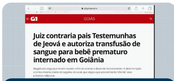
Testemunhas de Jeová não aceitam transfusão de sangue por questões religiosas. Tema polêmico na sociedade.

► (d) Ação racional com relação a valores: constitui um tipo de ação que é determinada por uma dada crença ou valor. São exemplos as crenças religiosas e as ideologias políticas.