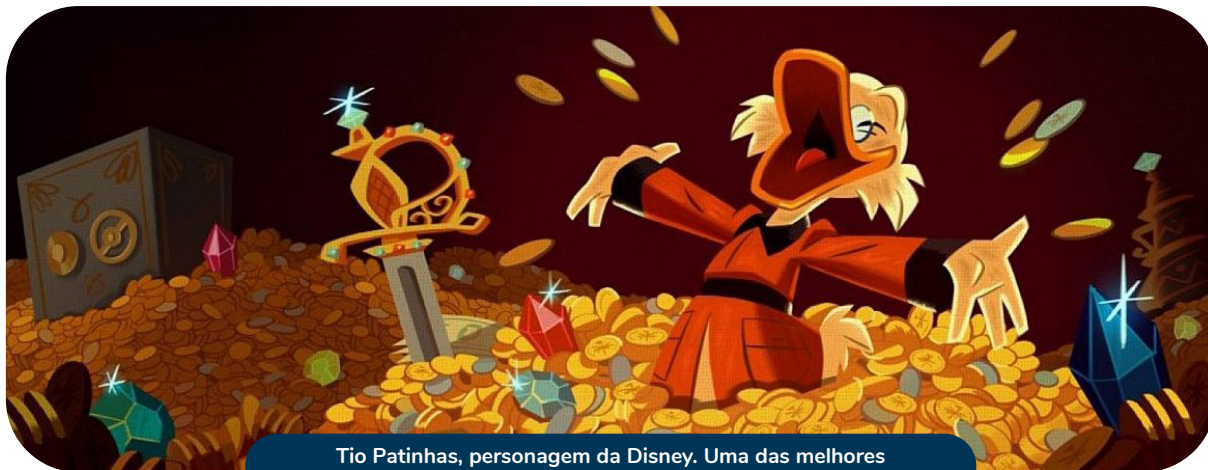
Tio Patinhas, personagem da Disney. Uma das melhores representações da acumulação de capital.

Ao mesmo tempo, Weber afirma que, dentro dessa perspectiva, o bom homem de negócios não deve ostentar a sua riqueza. Ele trabalha para ganhar dinheiro e reinveste esse capital. Isso é necessário para garantir a manutenção e a expansão do capitalismo, porque o lucro precisa ser renovado permanentemente.