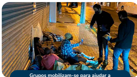
Grupos mobilizam-se para ajudar a população de rua durante a pandemia.

► (b) Ação afetiva: consiste na ação causada por um sentimento, que pode ser positivo ou negativo, como o amor, o ódio, a inveja, a solidariedade e a esperança etc.