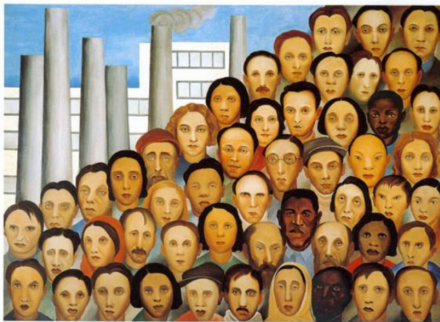
Operários, 1933, tela de Tarsila do Amaral (1886-1973)